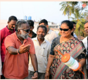
కమిటీ సభ్యులు పాల్గొన్నారు.